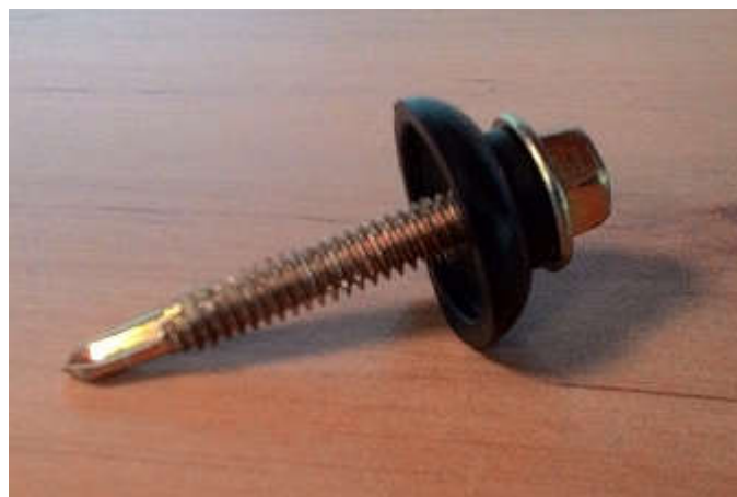
Hình ảnh đinh vít có đệm làm kín